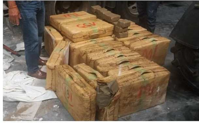
Agentes, incautando de hachís.

La Audiencia Provincial de Las Palmas absuelve a los 14 miembros de una banda en Canarias al anularse las escuchas telefónicas